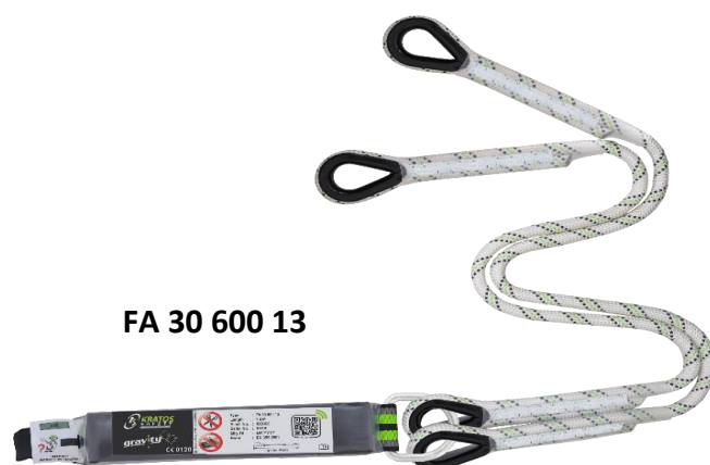
FA 30 600 13