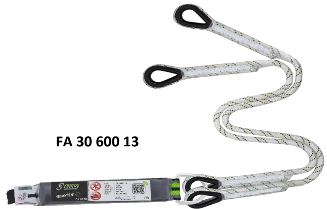
FA 30 600 13