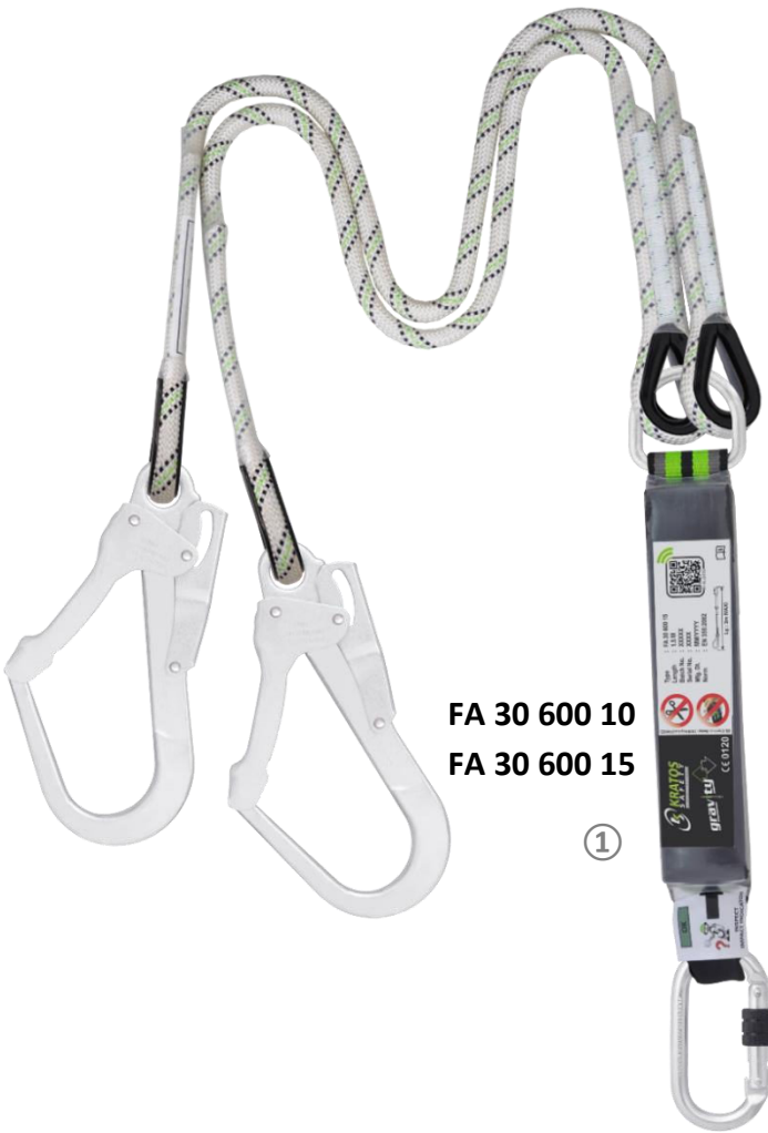
FA 30 600 10 FA 30 600 15